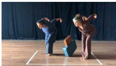
Exils création 2019