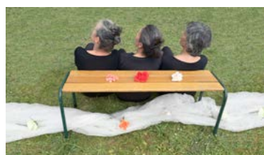
Un pas de côté 2017