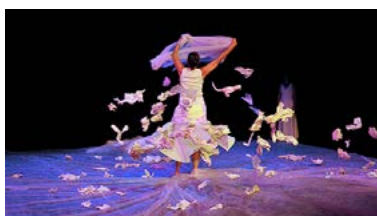
Le soupir de l'hiver