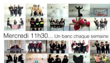
Mercredi 11h30 2013-14