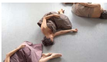
54 minutes chrono 2016