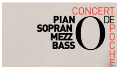
Vaux-sur-Seine 7 avril Carolles 28 et 29 juillet