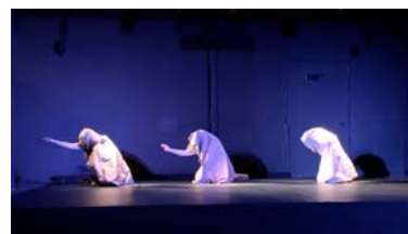
Vaux-sur-Seine 9 et 10 février