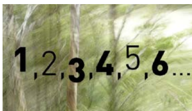
Paris 19 avril